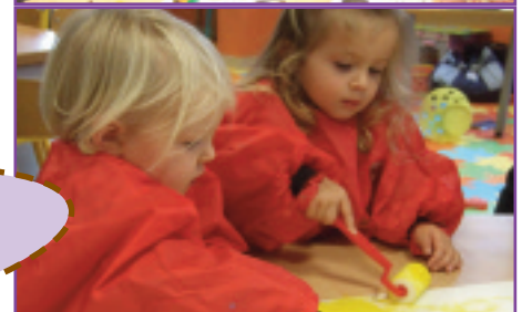
Instants partagés "Matins soleil", nov. 2011