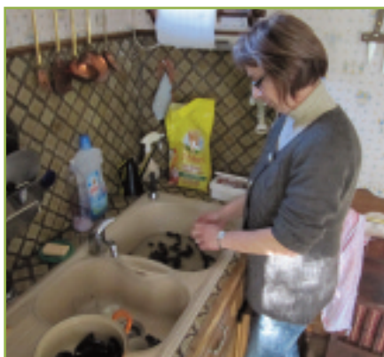
Une aide à domicile préparant le repas

Service mandataire : la personne âgée est employeur mais la Com de Com intervient pour toutes les démarches administratives et la gestion du personnel.