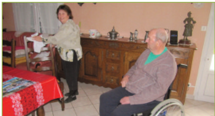
Une aide à domicile chez une personne âgée